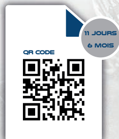
CERTIFICAT DE RÉTABLISSMENT