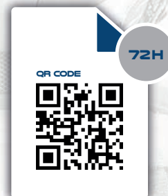
RT - PCR ANTIGÉNIQUE AUTOTEST