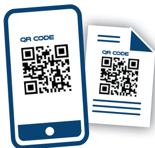
PASS SANITAIRE : SUPPORT NUMÉRIQUE OU PAPIER