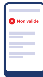
La personne ne peut pas accéder à l'enceinte sportive.

En revanche, si l'application fait apparaître le message suivant :