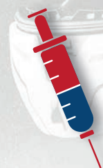
SCHÉMA DE VACCINATION COMPLET