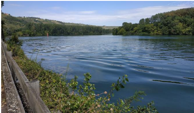
L'île du Beurre