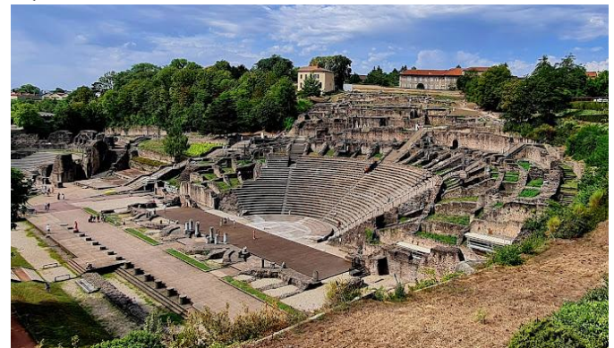
LUGDUNUM – Musée & Théâtre Romain