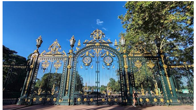
Parc de la Tête d'Or