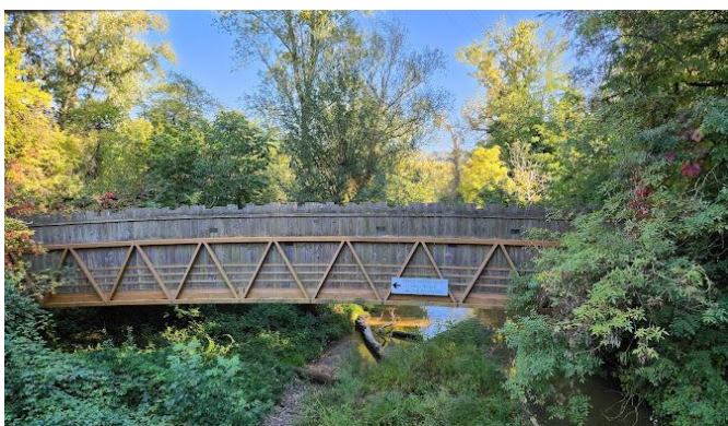
Centre d'observatoire de la Nature de l'île du Beurre