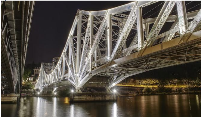
Pont de la Mulatière

Lyon, ville française de la région historique Rhône-Alpes, se trouve à la jonction du Rhône et de la Saône. Son centre témoigne de 2 000 ans d'histoire, avec son amphithéâtre romain des Trois Gaules, l'architecture médiévale et Renaissance du Vieux Lyon et la modernité du quartier de la Confluence sur la Presqu'île. Les Traboules, passages couverts entre les immeubles, relient le Vieux Lyon à la colline de La Croix-Rousse.