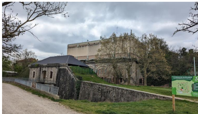
Fort de la côte Lorette