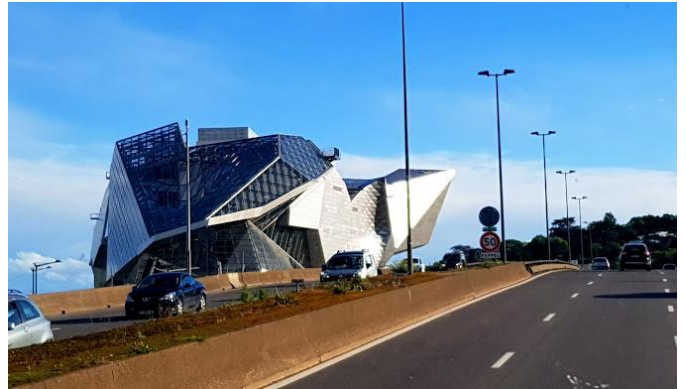
Musée de Confluence