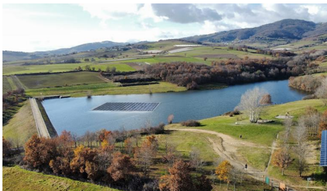
Lac de la Madone