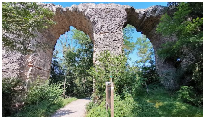
Aqueduc romain du Gier – Le Garon