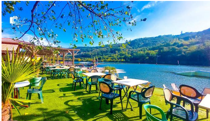
Base nautique de Condrieu – Les Roches