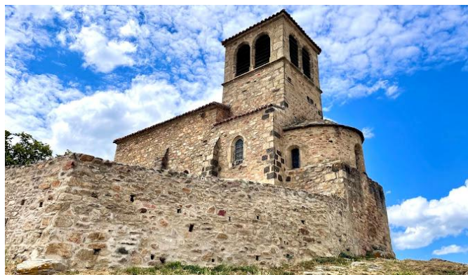
Chapelle St Vincent – St Laurent d'agny