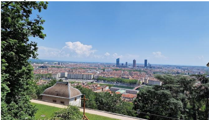
Parc des Hauteurs de Fourvière