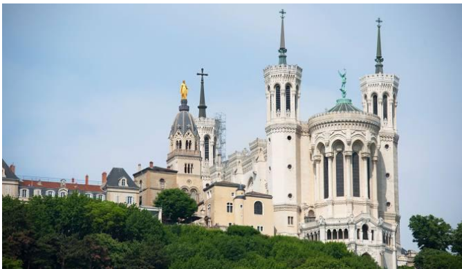
Basilique Notre-Dame de Fourvière