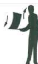
Drapeau agité de haut en bas